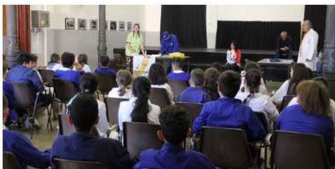
Incontro con le scuole elementari Garibaldi "Progetto Solidarietà"