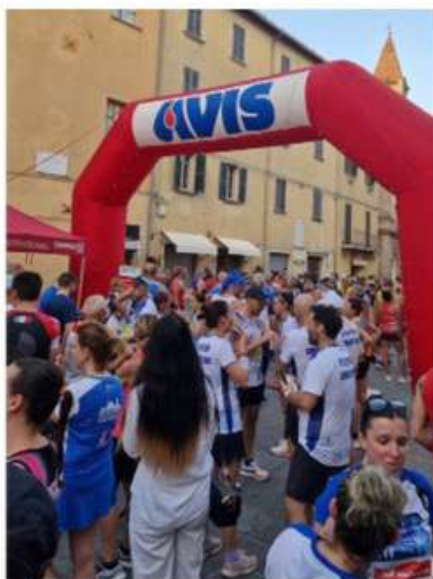
Con Atletica Umbertide "Corri Umbertide By Night"