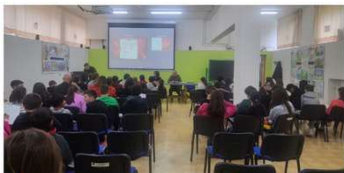
Incontro con le scuole Pascoli Mavarelli "Progetto Solidarietà"