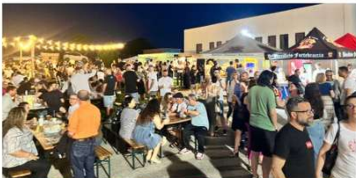
Raduno dei Giovani Avisini