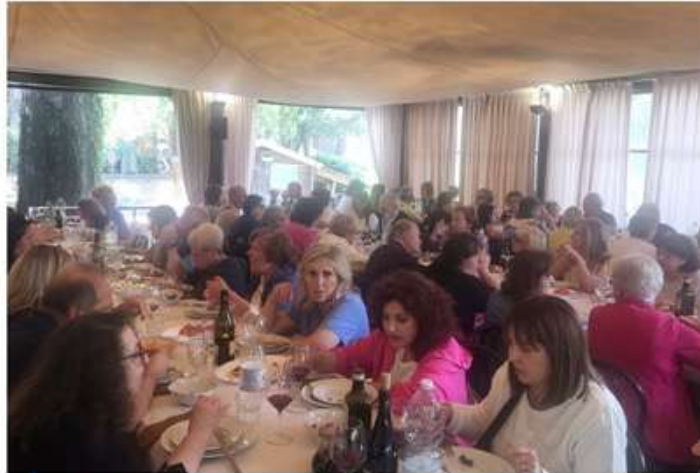
Scorcio partecipanti gita sociale "A Tavola"