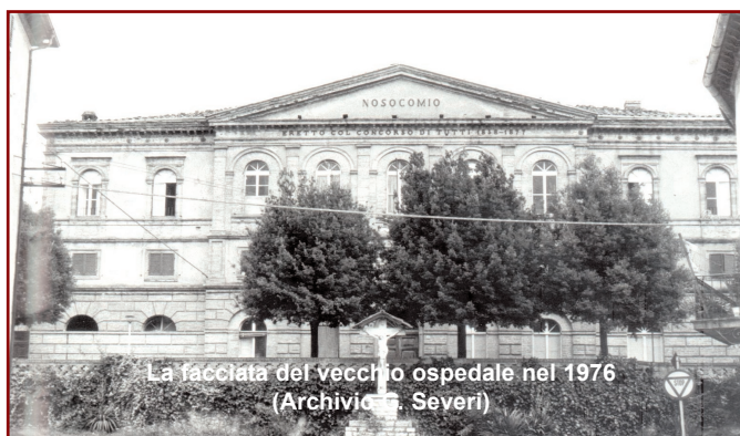
La facciata del vecchio ospedale nel 1976

A lei i nostri migliori auguri, il ringraziamento per il lavoro svolto e il benvenuto nella grande Famiglia Avis.