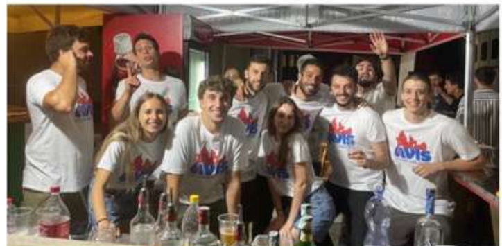
I giovani Avisini che hanno organizzato la festa