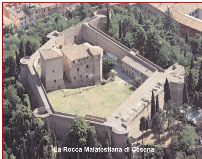
La Rocca Malatestiana di Cesena