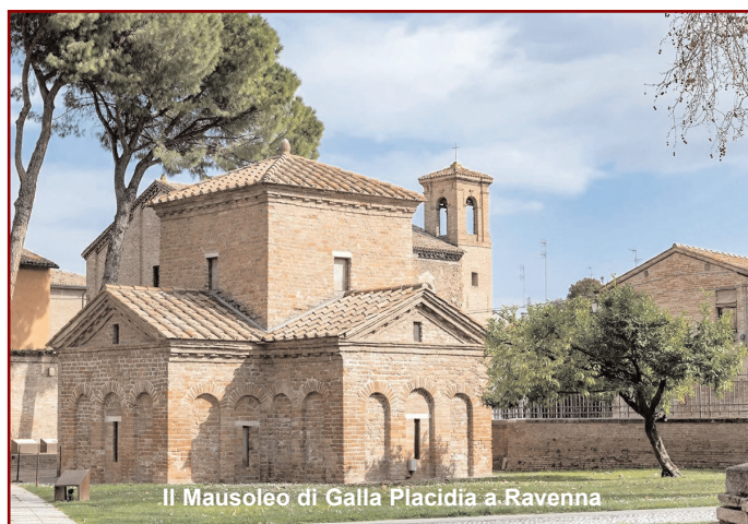
Il Mausoleo di Galla Placidia a Ravenna

Tutti i dettagli della gita verranno pubblicati nel prossimo numero di gennaio.